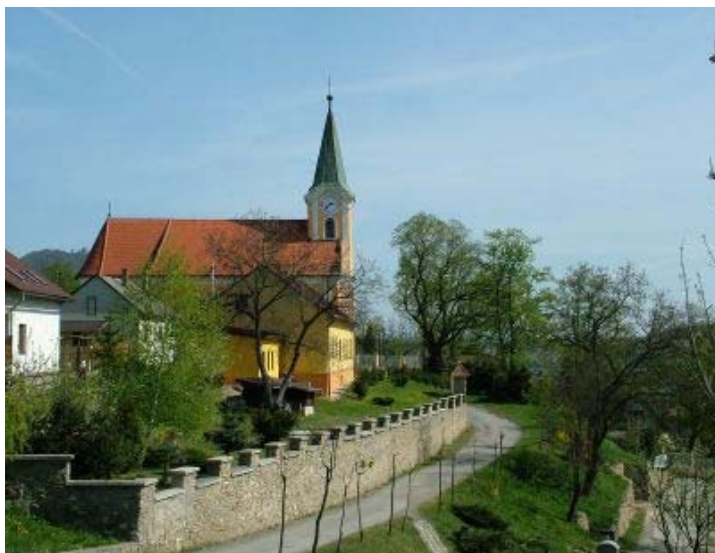
Kostol sv. Michala

Ku kostolu patrilo kedysi i cintorín, ktorý bol ohradený múrom. Zmienka o ňom je už v roku 1814. Druhý cintorín, dnes nazývaný starý, bol zriadený za dedinou. 17. júna 1873 došlo k jeho vysväteniu. Na kríži, ktorý sa tam nachádzal bol vyznačený letopočet 1932 no kríž existoval len do roku 1944. Rozlohou bol menší ako ten pôvodný. V roku 1910 je už v obci spomínaný i tretí cintorín. Bol najmenší spomedzi všetkých, jeho zriadenie si ale vyžiadala nedostatok hrobových miest. V tom čase sa už okolo kostola nepochovávalo a nedostatok miest bol aj na cintoríne v poradí druhom tzv. starom neďaleko miesta dnes nazývaného Hliník. 386