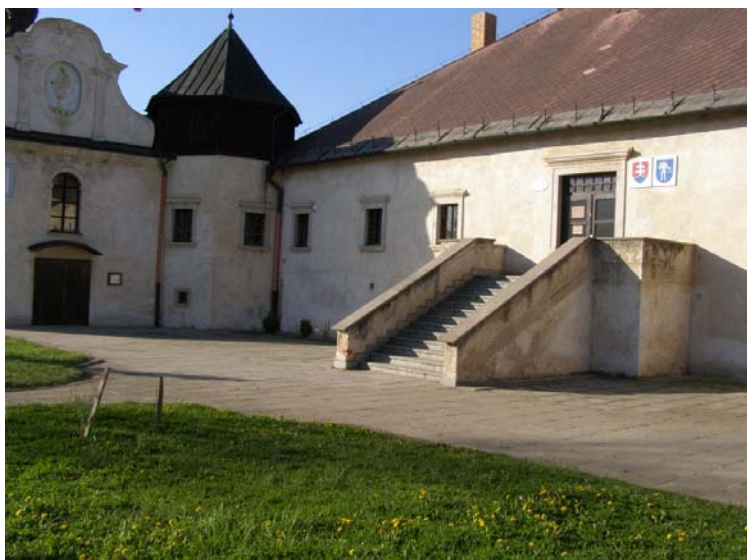
Renesančný kaštieľ a baroková kaplnka