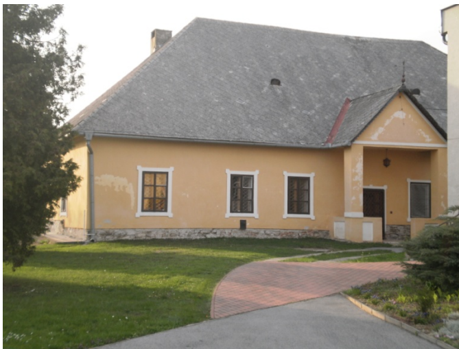
Kúria