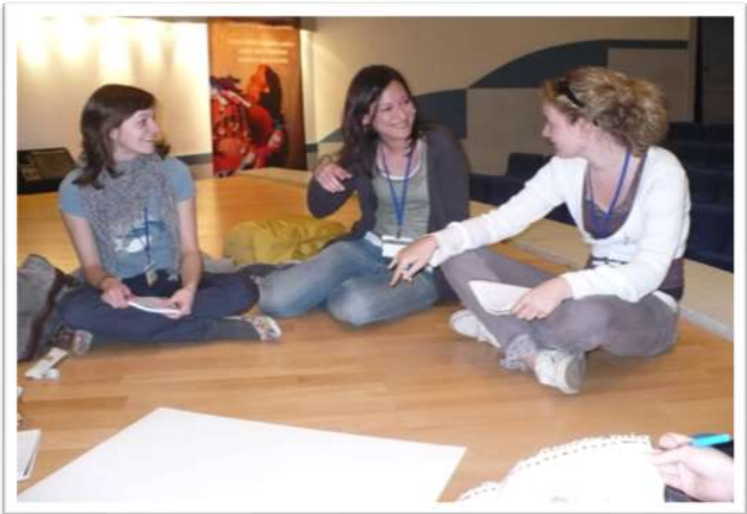
Študentské fórum 2010 Bolu.