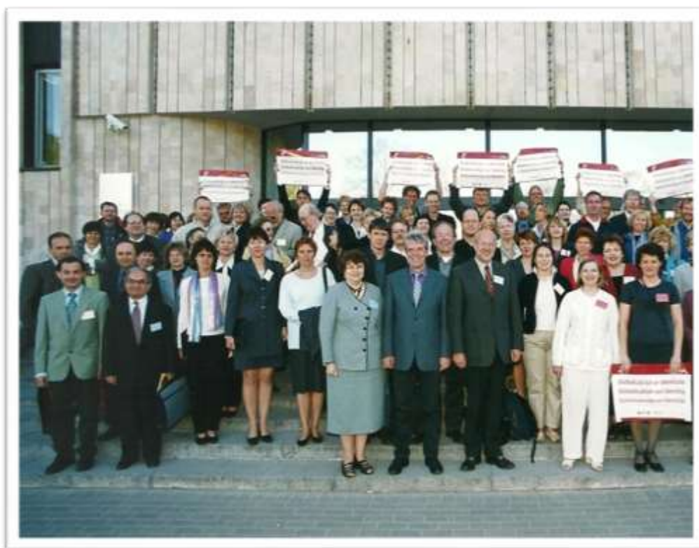
Kongres EAS 2001 Riga. Členovia predstavenstva a účastníci.