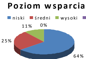
Wykres nr 1: Poziom wsparcia grona nauczycielskiego – relacje interpersonalne