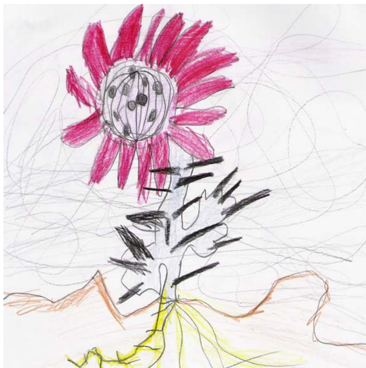
Chlapec (ZŠ B)