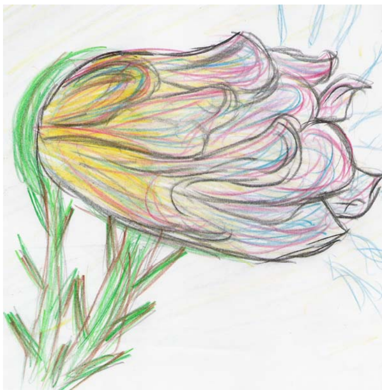
Dievča (ZŠ B)