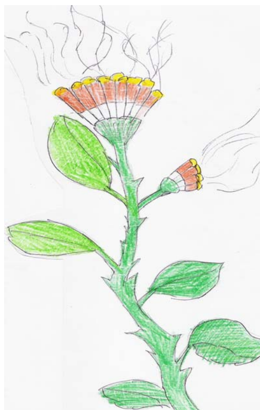
Chlapec (ZŠ C)