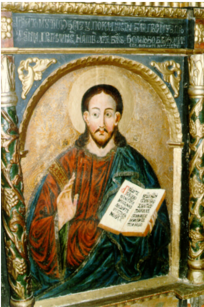
XXXI. Kristus Pantokrátor. Koniec 17. stor. Z ikonostasu drevenej Cerkvi Stretnutia Pána so Simeonom, Kožany.