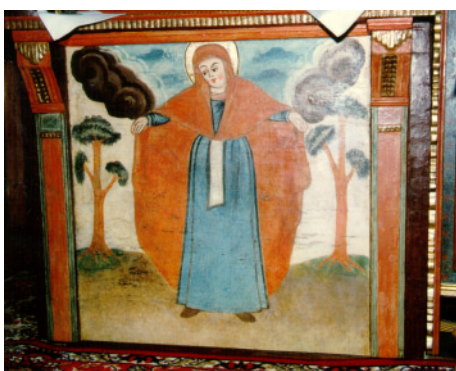
XXIII. Pokrov Bohorodičky (Mater Misericordia). Druhá polovica 17. stor. Predela ikonostasu drevenej Cerkvi Pokrova Bohorodičky, Korejovce.