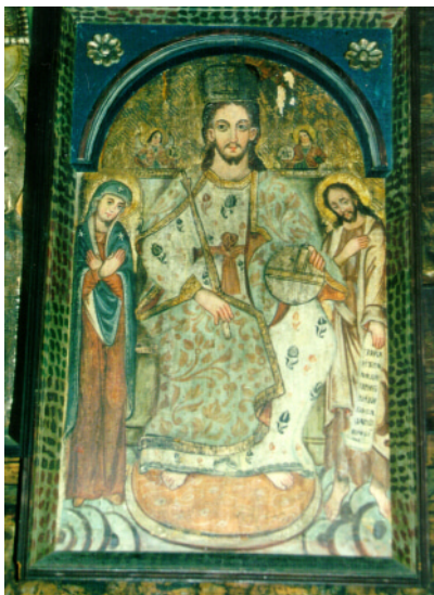
XXVI. Deésis. Koniec 17. stor. Drevená Cerkva Narodenia Bohorodičky z Malej Poľany (predtým v Habure), teraz v Hradci Králové, Česká republika.