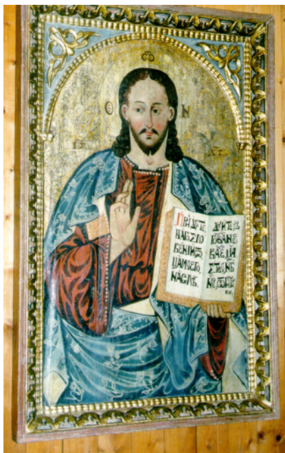
XXV. Kristus Pantokrátor. Druhá polovica 17. stor. Drevená Cerkva sv. Paraskevvy, Dobroslava.