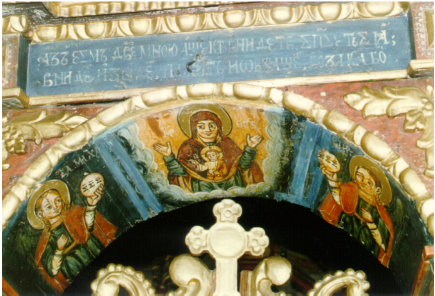
XXX. Bohorodička Bohovtelenie s archanjelmi. Koniec 17. stor. Oblúk nad Kráľovskými dverami drevenej Cerkvi Stretnutia Pána so Simeonom, Kožany.