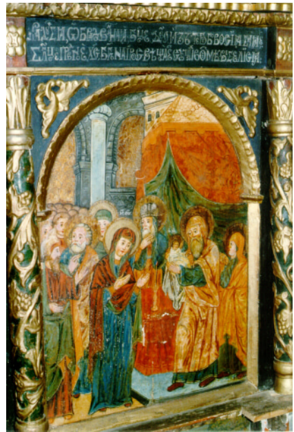
XXXII. Stretnutie Pána so Simeonom. Koniec 17. stor. Chrámová ikona, drevená Cerkva Stretnutia Pána so Simeonom, Kožany.