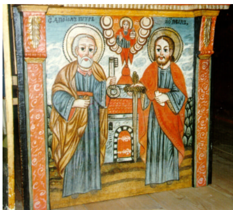
XXII. Sv. Peter a Pavol. Druhá polovica 17. stor. Predela ikonostasu v drevenej Cerkvi sv. Michala Archanjela, Nová Sedlica, teraz v skanzene Vihorlatského múzea, Humenné.