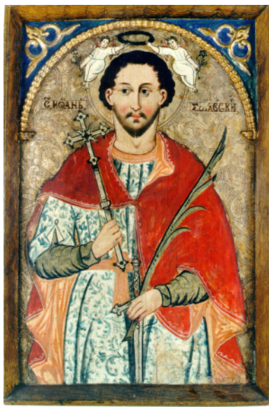
XXIX. Sv. Ján Sučavský. Koniec 17. stor. Z Cerkvi Zostúpenia Ducha Svätého, Nižný Hrabovec, teraz v Šarišskom múzeu, Bardejov.