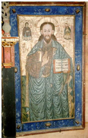
XXVII. Deésis. Posledná tretina 17. stor. Drevená Cerkva sv. Vasilija (Bazila) Veľkého, Krajné Čierno.