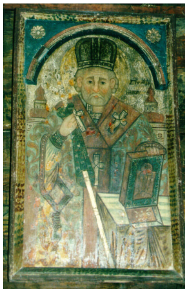
XXVIII. Sv. Mikuláš. Koniec 17. stor. Drevená Cerkva Narodenia Bohorodičky z Malej Poľany (predtým v Habure), teraz v Hradci Králové, Česká republika.